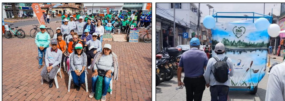
Imagen 3. Asociados TINGUA y representación del Humedal Gualí