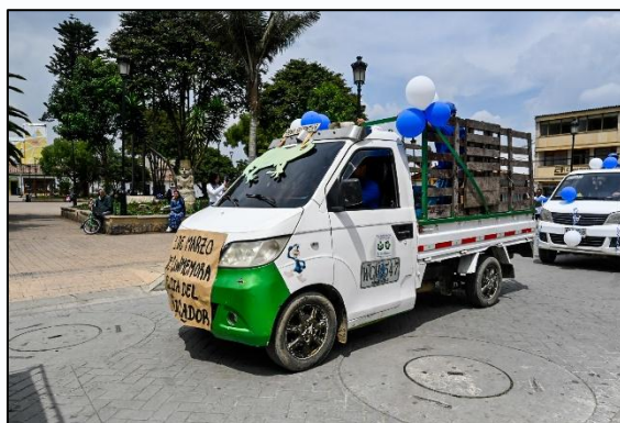
Imagen 1. Asociados ARBUIC y representación de anfibios y reptiles