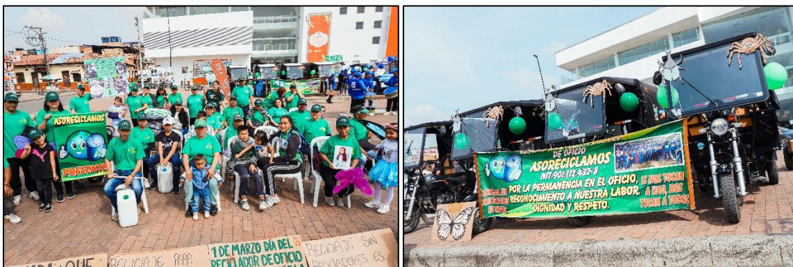
Imagen 6. Asociados ASORECICLAMOS y representación de los insectos del Humedal Gualí