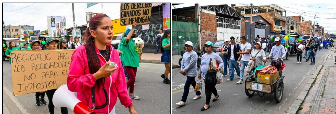
Imagen 7. Marcha

Las asociaciones de recicladores realizaron una marcha que partió desde la plazoleta Marqués de San Jorge hasta Centro Día. Durante el recorrido, portaron letreros y pancartas en los que expresaron libremente su lucha por la dignificación y el reconocimiento de su labor. Además, invitaron a la ciudadanía del municipio a comprometerse con la gestión integral de residuos sólidos y a practicar la separación en la fuente ya que es responsabilidad de todos.