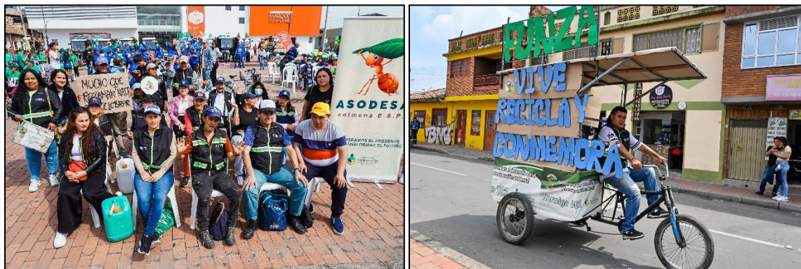
Imagen 2. Asociados ASODESA COLMENA y representación de Funza, Vive y Recicla