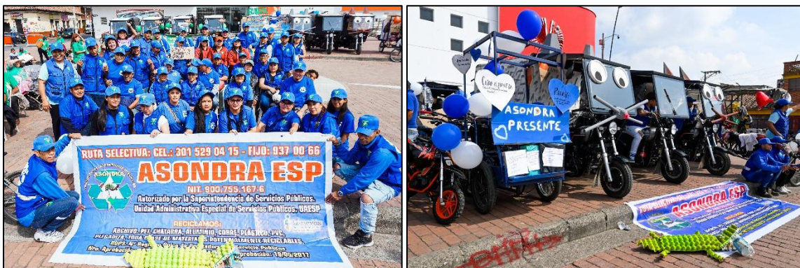
Imagen 5. Asociados ASONDRA ESP y representación de mamíferos del Humedal Gualí