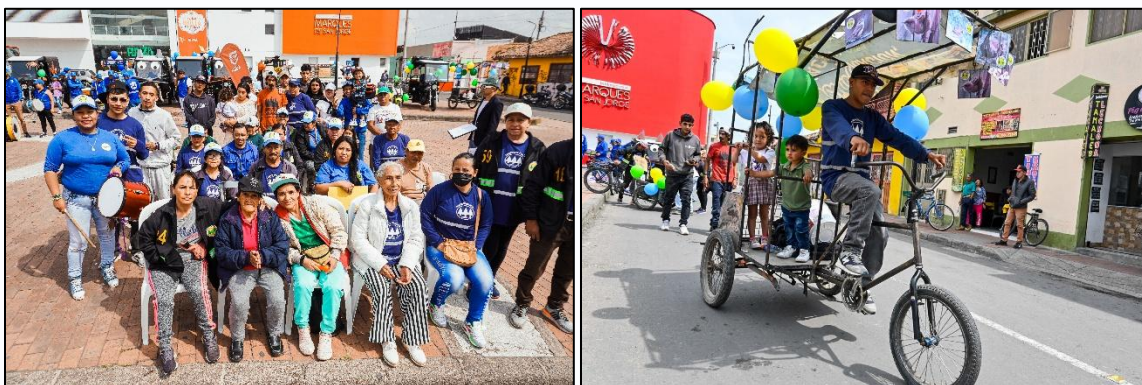
Imagen 4. Asociados ASOPRORECICLAJE y representación de aves del Humedal Gualí