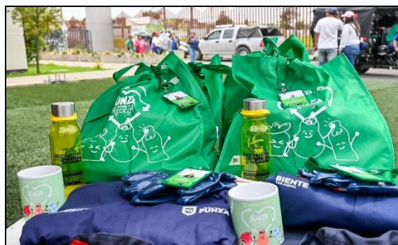
Imagen 9. Kit

Para cerrar la conmemoración del Día Nacional del Reciclador, se realizó la entrega de un kit a cada uno de los recicladores participantes del evento. El kit estuvo compuesto por un overol, una gorra pesquera, guantes, un mug, el carné de identificación como reciclador de oficio y un souvenir cortesía de OPAIN.